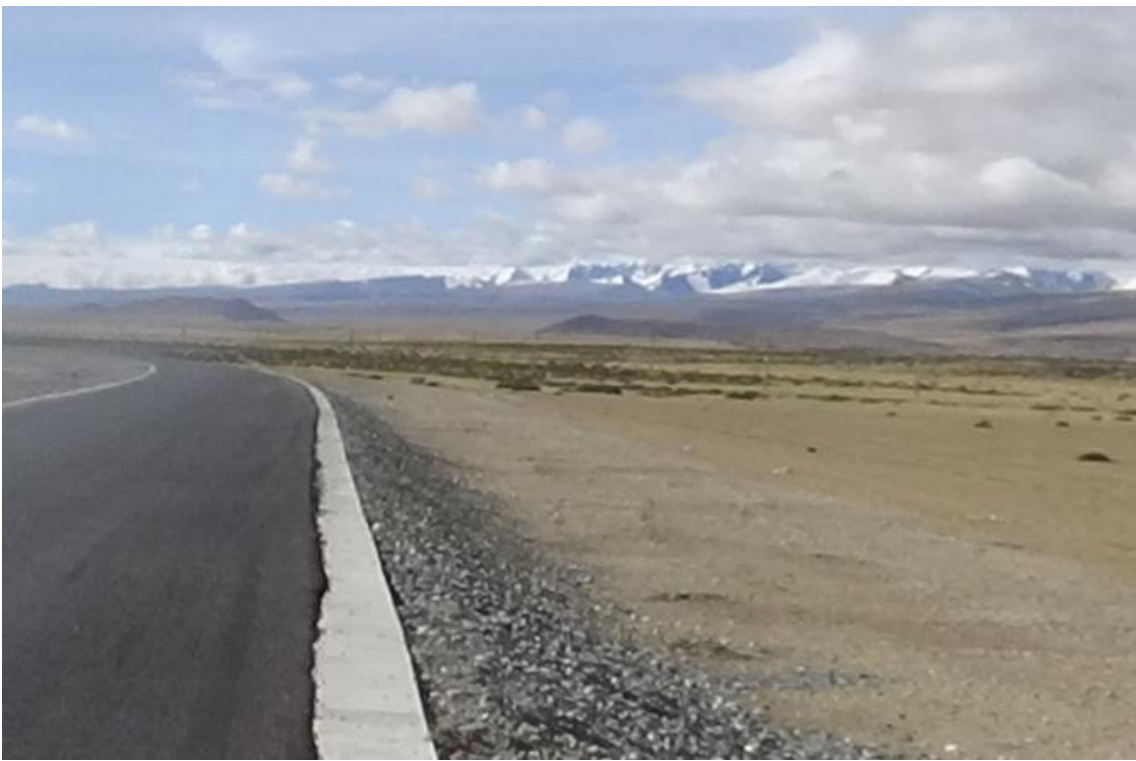
项目施工生产生活区