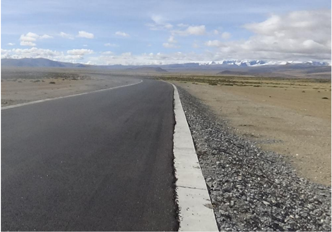
施工生产生活区迹地恢复平整