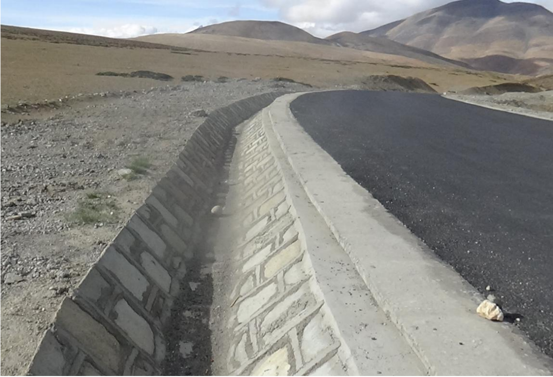
路基工程新修排水沟