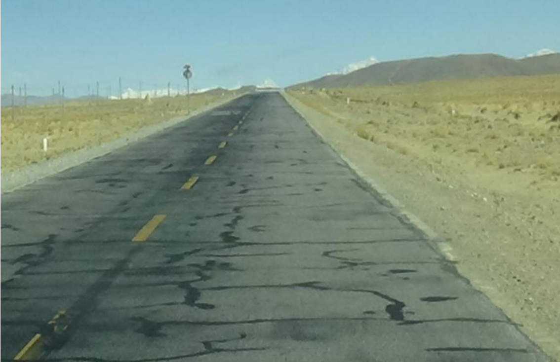
路基工程边坡种草