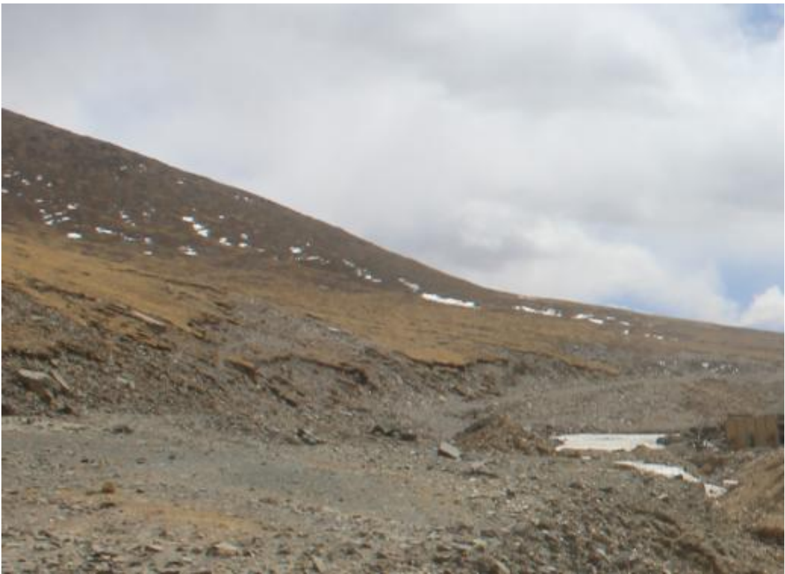
弃渣场迹地恢复平整